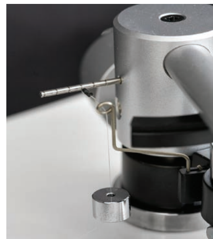
Tradycyjny antyskating – czyli ciężarek na żyłce.