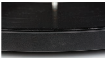
Talerz nie ma żadnej maty, a minimalnie większa średnica względem płyty sprawia, że zdejmowanie krążków wymaga nieco wprawy.