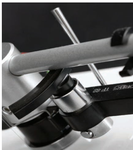
Mechanizm opuszczania ramienia nie ma tłumika, dźwigniką trzeba operować delikatnie.