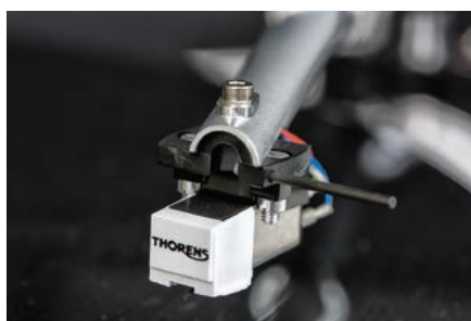
Fabrycznie TD203 uzbrojono we wkładkę MM z logo Thorensa, przypominającą produkty Audio-Technica.