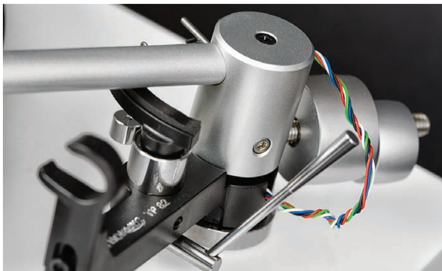
Ramie typu Uni-pivot oparte jest dodatkowo na wewnętrznych łożyskach stabilizujących.

Konsekwentnie spójne i skupione na średnicy, ale wsparte dynamicznym basem.